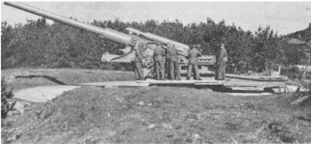
Tung rörlig kustartillerikanon i omaskerad övningsställning

underhållssynpunkt som en landstigning på öppen kust medför, sökte man begränsa genom att på franska kusten anlägga en gigantisk, konstgjord hamn, den s. k. »port Winston». Hamnen utgjordes av vågbrytare och pirar för urlastning och var helt flytande på stora betongkasuner, de största på ton med dimensionerna 18 x 18 x 60 m. Hela konstruktionen lär ha krävt, oavsett arbetet med överföringen och förankringen vid kusten, inte mindre än 5,5 miljoner vid denna tidpunkt helt säkert mycket dyrbara dagsverken. Det är sålunda av den största betydelse, att skärgårdsförsvaret