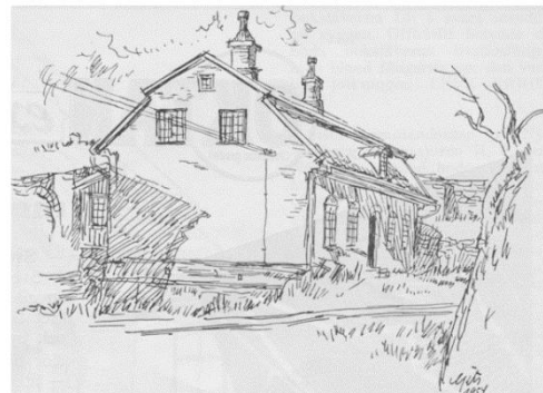
Utanför fästningen ligger ett långsträckt utanverk, det s.k. hornverket, med i vallarna inbyggda valv. Här finns också inåt staden en skyddad hamn med stenbryggor. Genom ett valv i muren kom man från den yttre båthamnen in i en inre, nu igenfylld sådan. Den vackra byggnaden var en gång fästningens sjukhus, om vilket det berättas, att utrymmet där var så trångt, att patienterna ofta fick ligga två i varje säng, för att alla skulle få plats. Byggnaden är uppförd omkring år 1775.

Danskarna gick nu in för att avspärra Göteborg från all tillförsel från sjösidan, samtidigt som en dansk här skulle angripa söderifrån och norska trupper anlägga en skans vid Rya nabbe. Man drog sig inte för att nedhugga håken på Vinga, och lägga två danska örlogsmän under holländsk flagg där ute, för att lägga beslag på alla svenska fartyg på ingående till Göteborg. I ett brev till rikskanslern rapporteras från Göteborg den 13 april 1644, att "den falske räfven, jutekungen, hade låtit förfärdiga en skans (blockhus) på en holme i den svenska skärgården, Kyrkogårdsholmen benämnd; där låg han med sin flotta och hade den 11 frestat, hur långt han kunde skjuta därifrån. Med lod hade han då nått öfver Käringberget, och med skrot in på landet under samma berg." Förutom denna skans började danskarna utföra försänkningar i inloppet, varigenom man ville förhindra att den holländska flottan kom svenskarna till undsättning. Kung Kristian reste under tiden till Bohus för att sammanträffa med sin svärson, ståthållaren i Norge Hannibal Sehestedt. Från Bohus sände han ett brev till landshövding Nils Mannersköld i Göteborg, och uppmanade denne att uppgiva staden. Landshövdingen svarade att om danske kungen ville besöka staden Göteborg, skulle han som en ärlig man och kavaljer veta att möta hans majestät på så sätt som en fiende bör mottagas. Brevet var daterat den 17 april 1644.