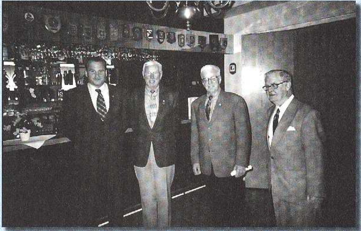
Fyra av årets 'veteraner' framför regementsofficersmässens bar.